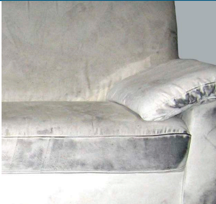
Textilcouch mit starker Rußbeaufschlagung

Generell gilt: Vor einer Reinigung wird an verdeckter Stelle geprüft, inwieweit die Stoffe farbecht und reinigungsfähig sind. Bei der Reinigung ist darauf zu achten, dass die Polster nicht durchnässt werden. Diese Genauigkeit gilt bis ins Detail: Ein getackelter Blindstoff zwischen Polster und Bezug zum Beispiel wird entfernt, um zu überprüfen, ob ggf. die Federn korrodiert sind. Holz- und Metallflächen werden durch Abkleben mit Folie vor Feuchtigkeit geschützt.