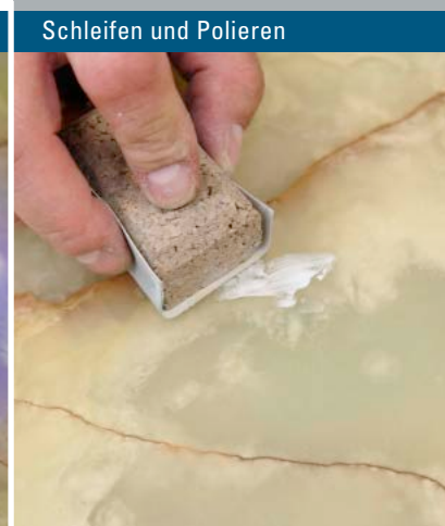
Schleifen und Polieren