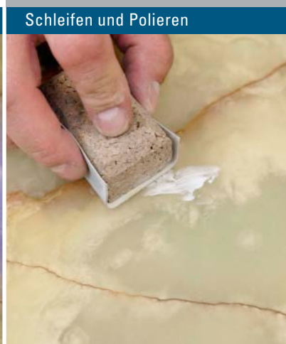
Schleifen und Polieren