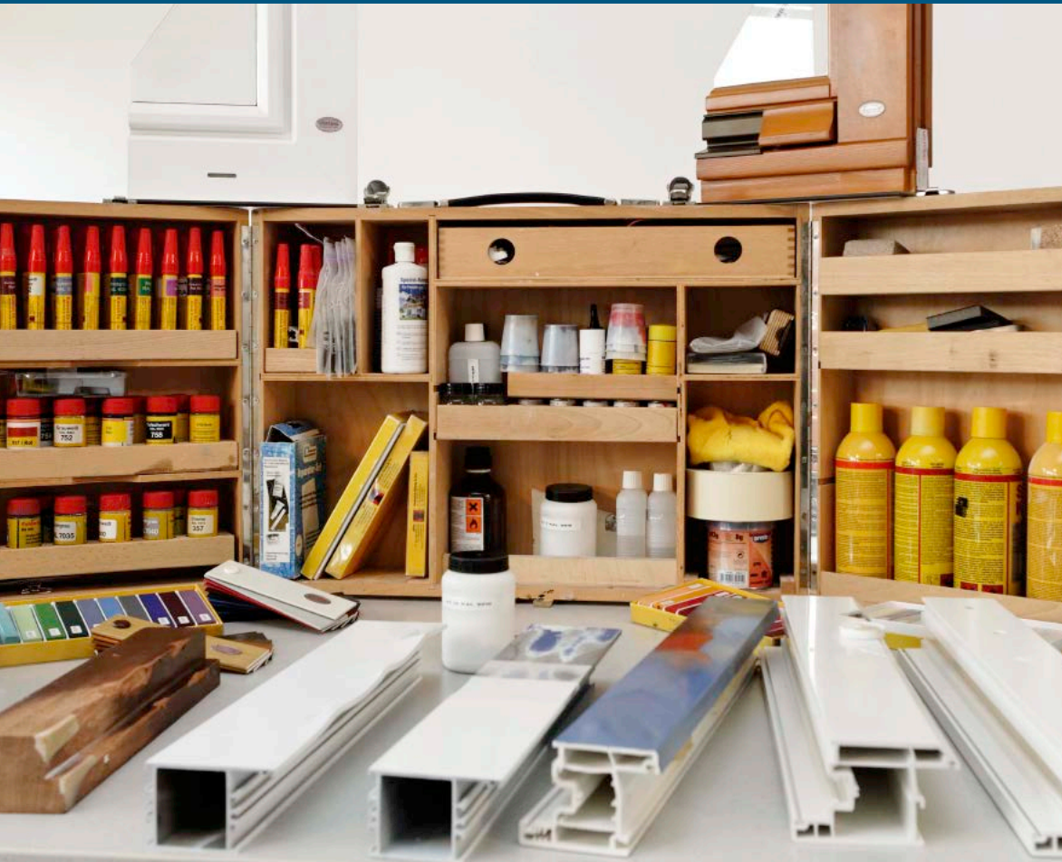
Standardkoffer unserer ED-Experten