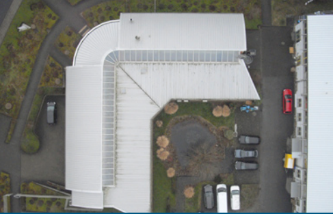
Flughöhe ca. 70 m