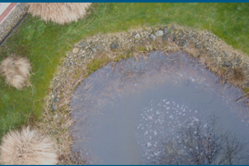
Flughöhe ca. 5 m

Das „Auge“ der Drohne ist eine hochauflösende 10-Megapixel-Fotokamera. Entscheidender Vorteil: Die digitalen Bilder sind „georeferenzierbar“ – das heißt, sie lassen sich exakt an den bestehenden geographischen Koordinaten ausrichten. Auf diese Weise können fotografierte Objekte genau verortet werden. Die georeferenzierten Bilddaten eignen sich auch ideal für Risk-Management-Systeme wie das Sprint-eigene NOA, denn