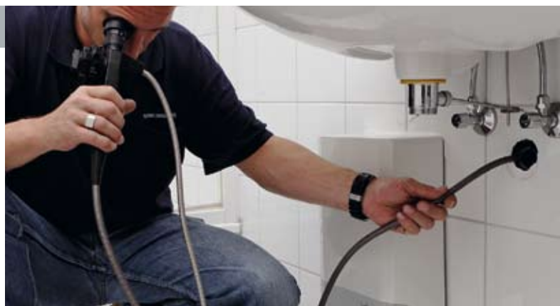
Sehen, was dahinter steckt: die Endoskopie

Um Schäden in Hohlräumen, wie Installations-schächten und abgehängten Deckenkonstruktionen, ermitteln zu können, werden technische Hilfsmittel wie Endoskope eingesetzt. Über vorhandene Öffnungen oder eine 8–10-mm-Bohrung in den Hohlraum wird dieser durch das Einführen der Optik ausgeleuchtet. Durch diese Technologie wird unnötiges Aufschlagen ganzer Geschosshöhen verhindert.