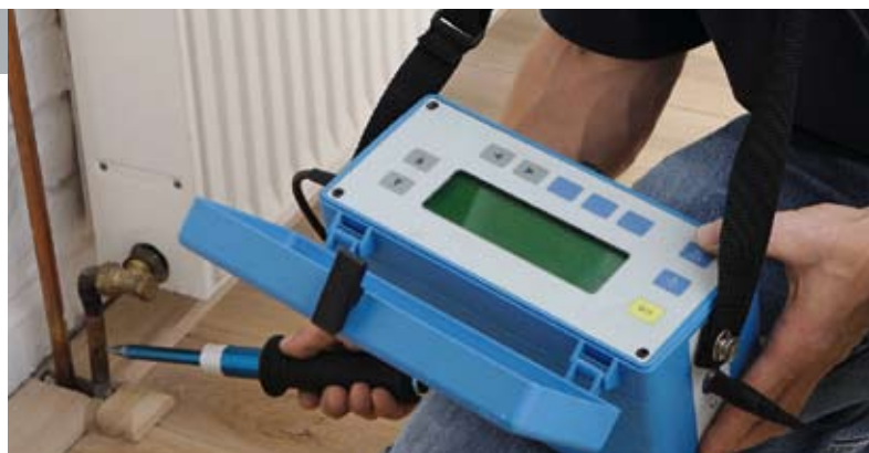
Elektroakustische Leckageortung: Hochleistungs-Mikrofone im Einsatz

Die elektroakustische Leckageortung ist an jedem druckwasserführenden System einsetzbar, um Leckstellen zu lokalisieren. Über Hochleistungsmikrofone können Fließgeräusche in Abhängigkeit zur Schallgeschwindigkeit des Rohrwerkstoffes hörbar gemacht werden. Die Geräuschentwicklung bzw. die höchste Strömungsgeschwindigkeit ist an der Wasseraustrittsstelle bei direktem Verbund zur Oberfläche lokalisierbar.