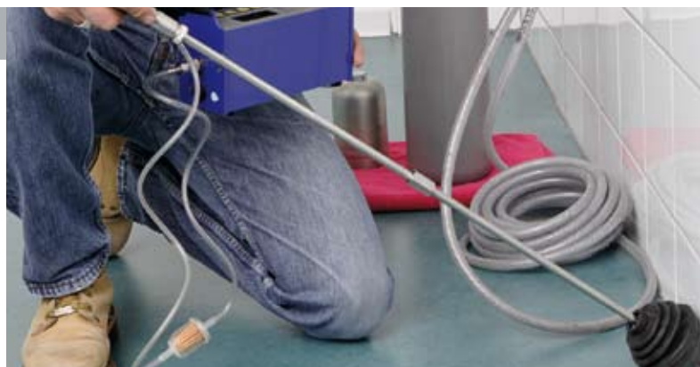
Gasetektion: das Messgerät „riecht“ die Leckage

Die Gasetektion ist eine universell einsetzbare Technologie. Durch das Eingeben von Spürgas, welches leichter als Luft ist und gute diffusionsfähige Eigenschaften besitzt, sind Leckstellen lokalisierbar. Der vorhandene Gasaustritt aus der Fehlstelle wird mittels Gasetektor über das Ansaugen des Gas-Luft-Gemisches ermittelt und ausgewertet.