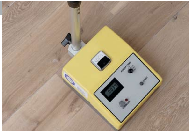
Atomare Leckageortung: die Neutronensonde

Die Neutronensonde wird eingesetzt, wenn im Fußbodenaufbau schadenbedingt Wasser vermutet wird. Dazu werden kleinste atomare Teilchen auf die betroffene Fläche projiziert. Treffen diese Teilchen auf ein Wasserstoffatom, werden sie verlangsamt und geben dabei eine Strahlung ab. Diese wird von einem Messgerät quantitativ registriert, sodass sich Rückschlüsse auf den Wassergehalt des Bodenmaterials ziehen lassen.